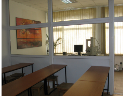
Laborator de materiale avansate