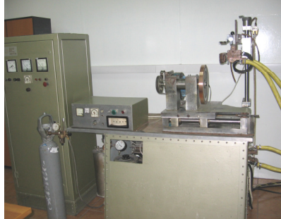
Laborator de metale amorfе