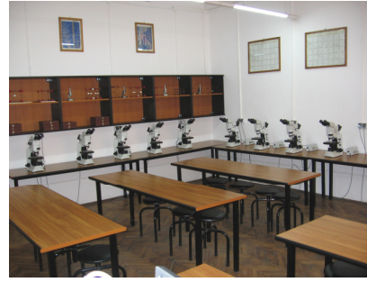
Laborator de microscopie optică