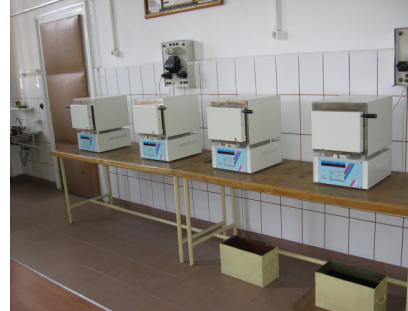
Laborator de tratamente termice