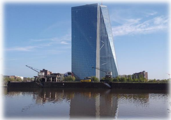
Sediul Băncii Centrale Europene în Frankfurt am Main, Germania