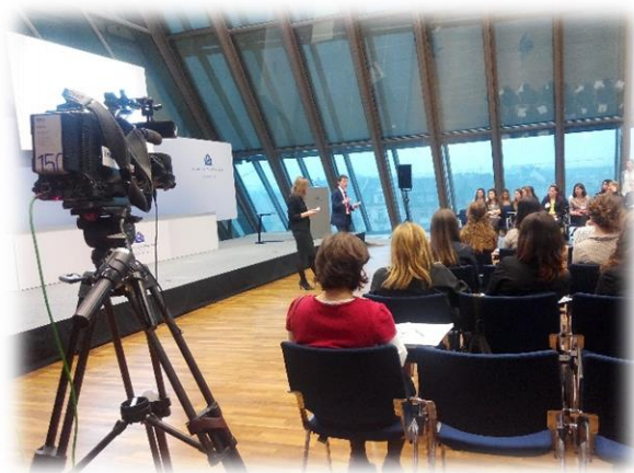
Eveniment Female Talent@ECB (04.05.2017)

Banca Centrală Europeană are ca principală atribuție menținerea stabilității prețurilor în zona euro și astfel, conservarea puterii de cumpărare a monedei unice. Creată în 1998 BCE este una dintre cele mai noi instituții a Uniunii Europene.