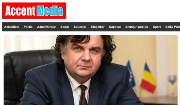
O nouă inițiativă a Universității Politehnica Timișoara – Solidaritate în Cercetare și Educație cu Ucraina

După ce, cu câteva zile în urmă, întindea o mână de ajutor refugiaților din Ucraina, prin punerea la dispoziție a 120 de locuri de cazare în căminele proprii, Universitatea Politehnica Timișoara lansează o nouă inițiativă pe care și-o dorește generalizată la nivel național și chiar internațional – Solidaritate în Cercetare și Educație cu Ucraina.