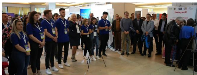
Zeci de firme, sute de tineri și mii de oferte la cea de-a XXII-a ediție a Zilelor Carierei de la UPT

Actualitate Politic Administrație Social Educație Timp liber Național Anunțuri publice Sport Editia Print