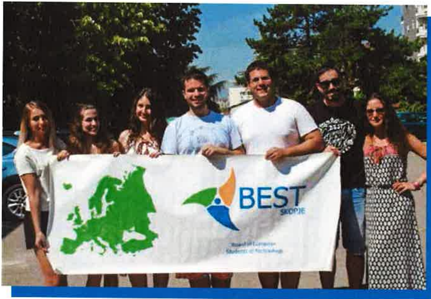
~The XXXI International Board~

BEST (Board of European Students of Technology) este o organizație internațională, non-profit și non-guvernamentală formată din studenții de la facultățile cu profil tehnic din Europa. În prezent suntem activi în 34 de țări, în 97 de grupuri locale BEST, cuprinzând peste 3300 de membri.