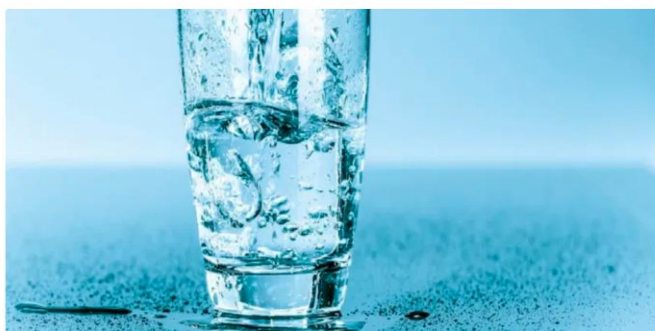
AquaSensTim, simpozion online la UPT dedicat Zilei Mondiale a Apei

Actualitate Politic Administrație Social Educație Timp liber Național Anunțuri publice Sport Editia