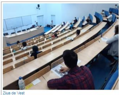
Ziua de Vest

In fiecare an, Universitatea Politehnica Timisoara vine in sprijinul elevilor de liceu, oferindu-le cursuri gratuite de pregatire la matematica, utile atat pentru cei care doresc sa urmeze una dintre facultatile institutiei, cat si pentru pregatirea examenului de bacalaureat. Chiar daca sunt adresate in special potentialilor studenti ai UPT, indiferent de facultatea pentru care opteaza si independent de forma admiterii (concurs cu probe de verificare sau concurs de dosare), participantilor la