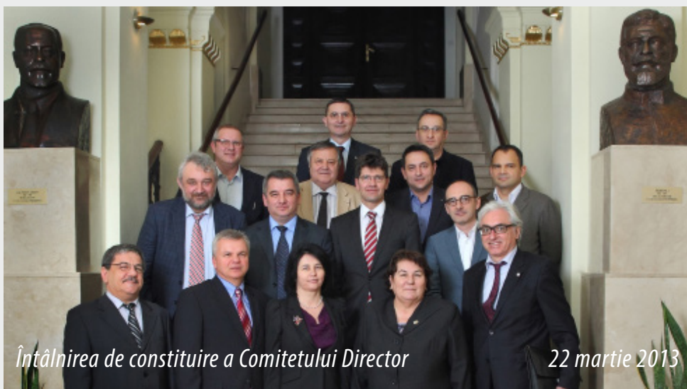
Întâlnirea de constituire a Comitetului Director